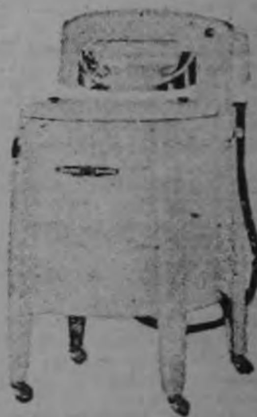
LAVADORA DE BOLILLO