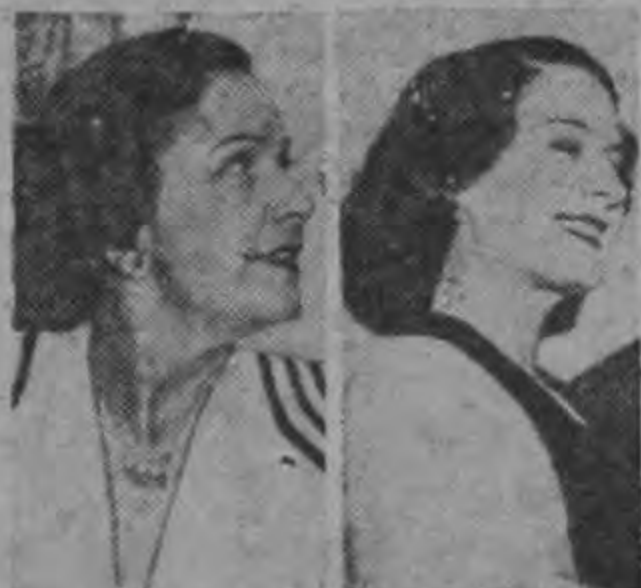
Norma Talmadge Norma Shearer