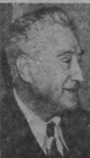
Francis X. Bushman