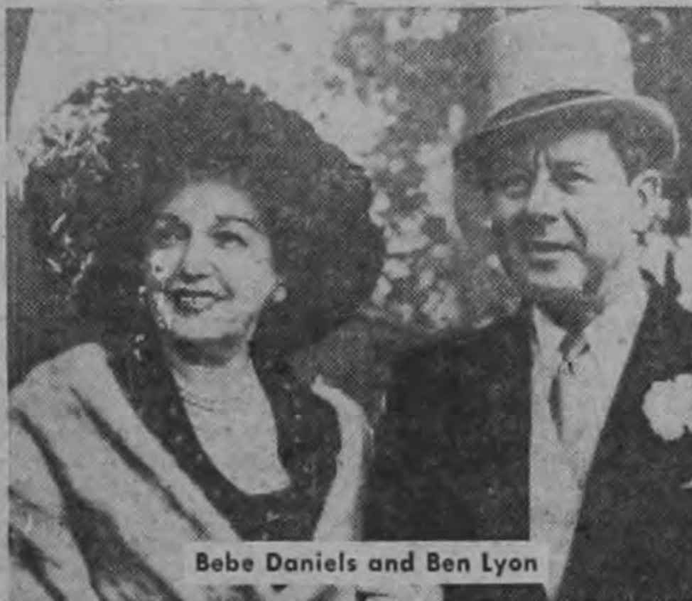
Bebe Daniels and Ben Lyon