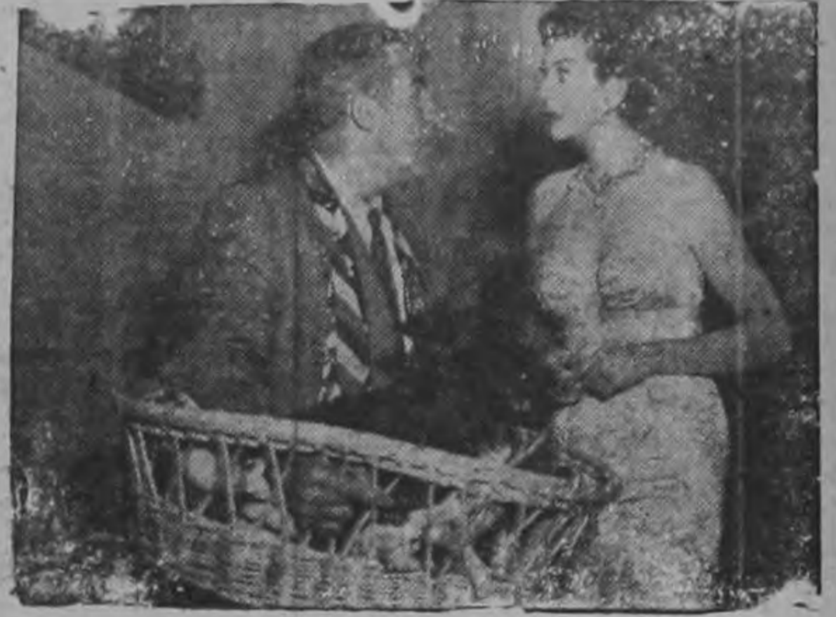
REGALO CON PROBLEMAS... Algunas veces los regalos de los días festivos presentan un problema a quienes los reciben, lo cual pudiera ser la causa de esta escena entre Rosalind Russell y Paul Douglas. Miss Russell y Douglas son co-estrellas de Marie Wilson en la comedia de Independent Artists, que distribuye la RKO Radio, "Desventuras de una Recluta", presentación de Frederick Brisson que la RKO Radio distribuye.

CLUB AMATEUR DE PESCA FRATERNIDAD, SALUD Y DEPORTE.